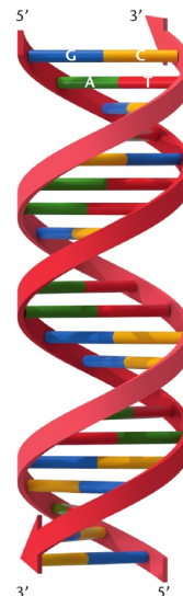
Kilde: Figur 103 Bioteknologi A bind 1. Illustration: Claus Lunau

I dette forsøg oprenses DNA fra kiwifrugter. Først nedbryder man materialet mekanisk til mindre dele. Derefter nedbryder man cellernes membraner og cellevæg ved hjælp af opvaskemiddel og salt. Derefter filtreres celleresterne fra cellens DNA og opløste proteiner. Opløste proteiner (herunder histoner) kan fjernes fra DNA ved hjælp af proteaser, og til sidst kan DNA udfældes i iskold ethanol. Til sammenligning kan man prøve at oprense sit eget DNA fra celler i mundhulen.